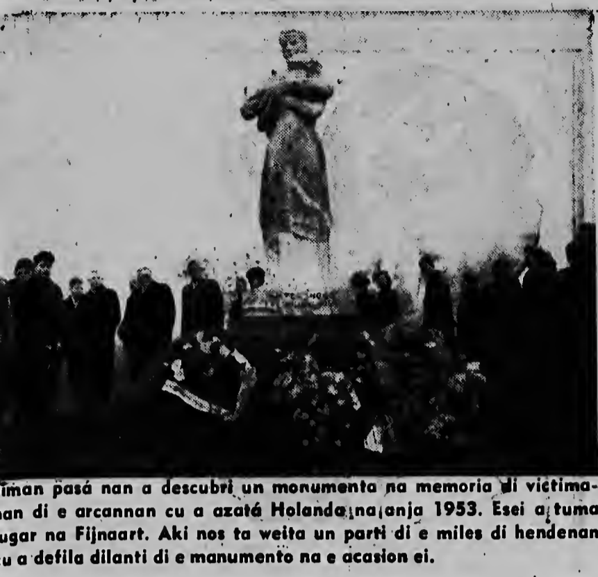
Iman pasá nan a descubri un monumento na memoria di víctima di un accidente aéreo na azafé Holandés na oronja 1953. Esei a tuma lugar na Fijnart. Aki nos ta weita un parti di e miles di hendenan a defila dilanti di e monumento na e ocasion ei.